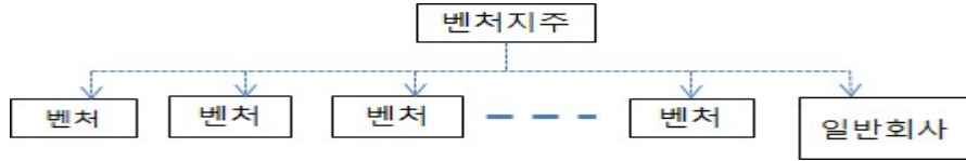
<참고> 벤처지주회사 개념도

□ (현황) 벤처지주회사 제도는 중소 벤처기업의 육성을 위하여 도입되었으나, 그 활용도가 미미한 상황